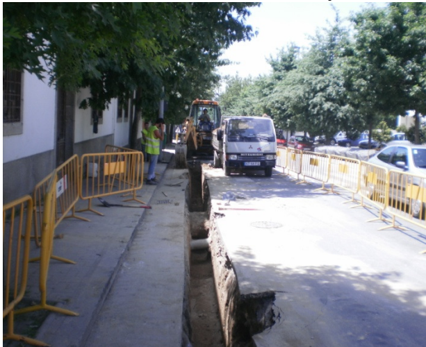
Rede Secundária de Gás Natural - Felgueiras