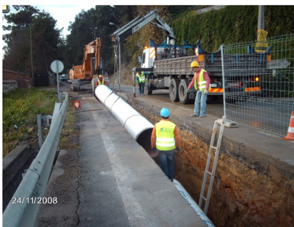
Empreitada de Instalação da nova linha de adução Jovim Nova Sintra – Troço D – Conduita FF de Ø 900