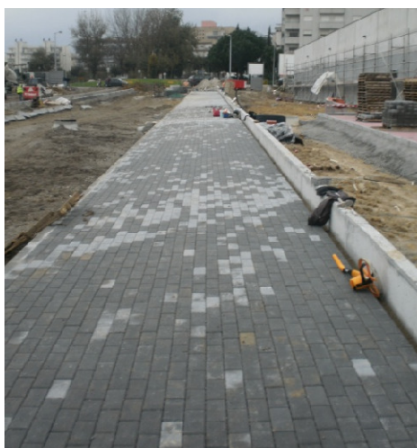
Passeio em Pavê - Felgueiras