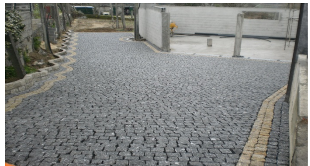
Calçada em Cubo