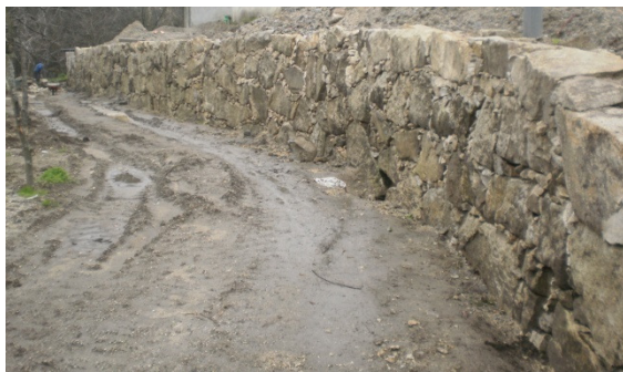
Muros em Pedra Natural