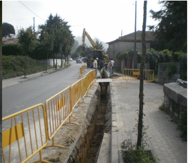
Rede Secundária de Gás Natural – Felgueiras