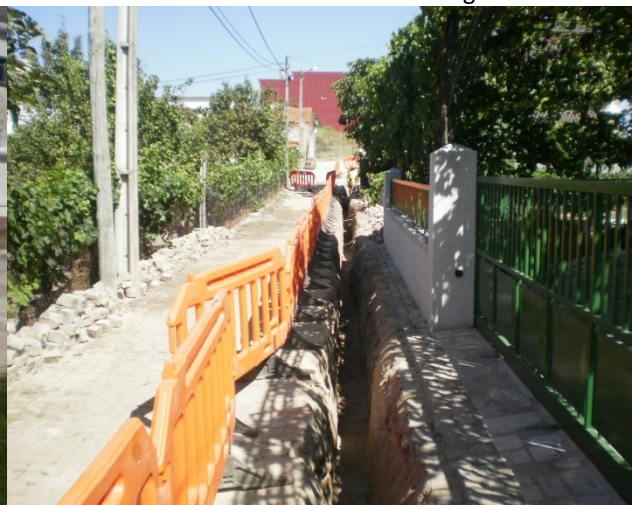
Rede Secundária de Gás Natural - Chaves