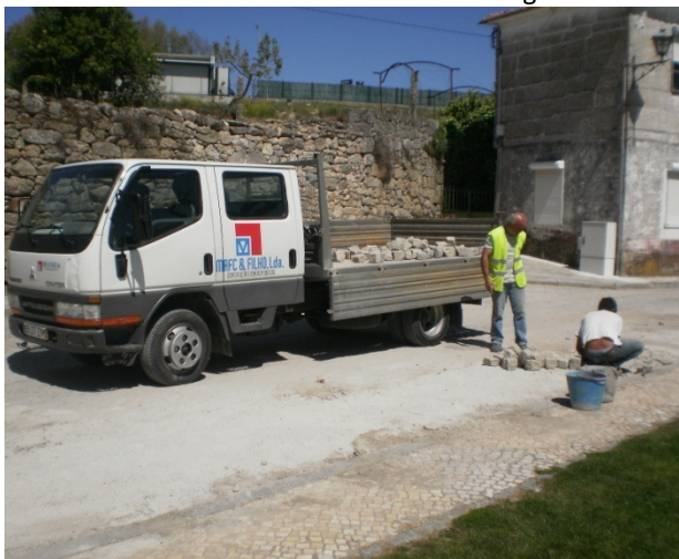
Rede de Banda Larga da Terra Quente Transmontana