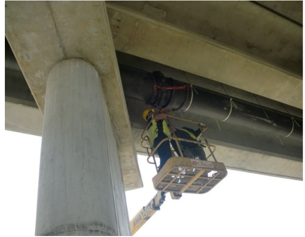
Conduta Suspensa FFD DN500 - Aveiro