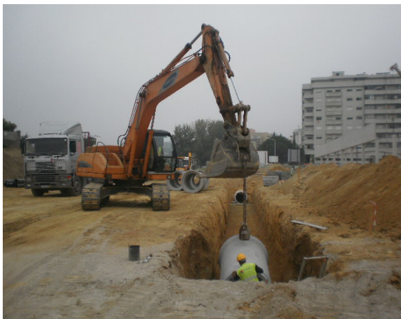
Av. Lidl - Felgueiras