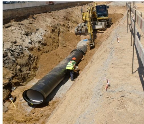
Rede Abastecimento de Agua FFD DN800 – Gaia