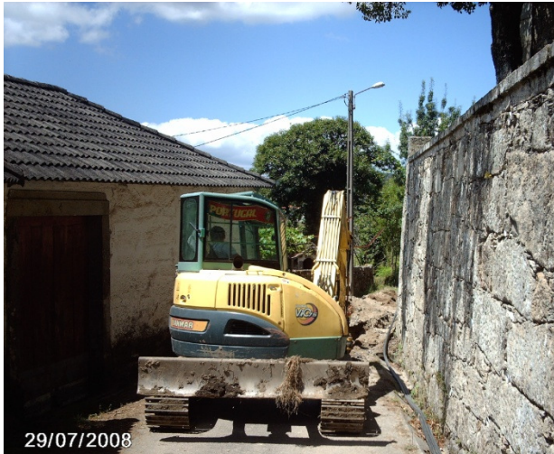
Rede Comunitária do vale do Minho – Infraestruturas de Telecomunicação