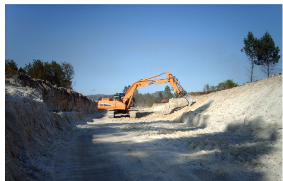
Desaterro – Guimarães