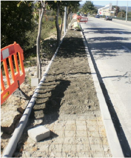
Passeio em Betão – Chaves