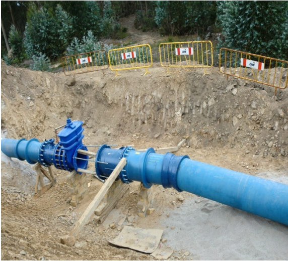
Rede Abastecimento de Agua FFD DN500 – Aveiro