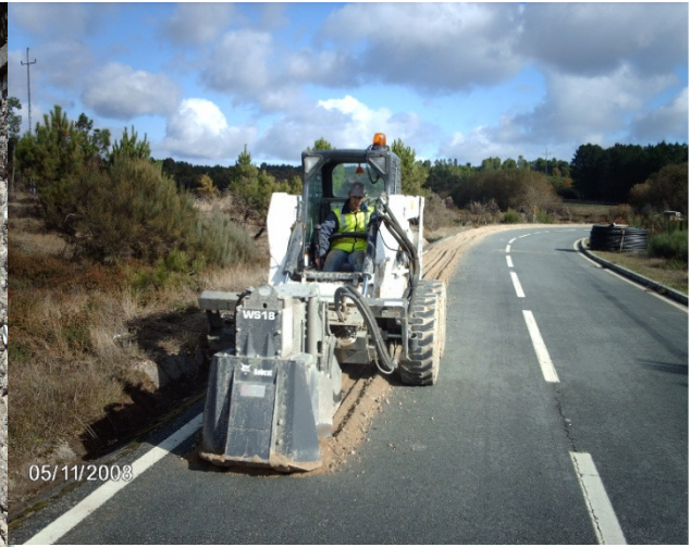
Rede de Banda Larga da Terra Quente Transmontana