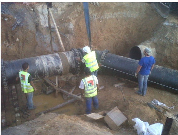
Rede Abastecimento de Agua FFD DN800 – Gaia