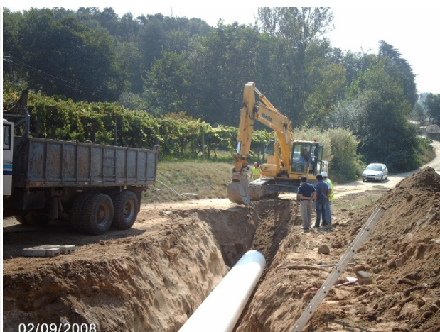
Empreitada de Instalação da nova linha de adução Jovim Nova Sintra – Troço D – Conduita FF de Ø 900