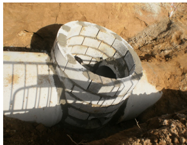
Av. Lidl - Felgueiras