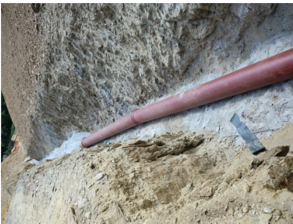
Saneamento FFD DN400 - Gaia