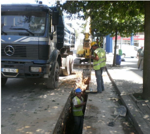
Rede Secundária de Gás Natural – Felgueiras