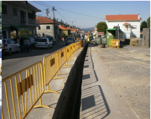
Rede Secundária de Gás Natural - Felgueiras