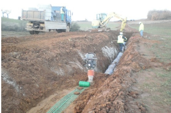
Aguas Pluviais - Bragança