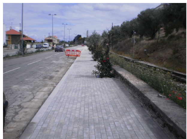
Passeio em Pavê – Mirandela