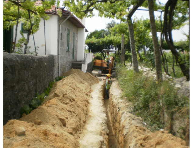
Rede Secundária de Gás Natural - Felgueiras